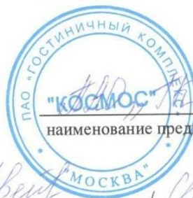
наименование предприятия (организации), должность

Составитель (автор): Охотина Е.Ф. преподаватель МТКП, РЭУ им. Г.В.Плеханова