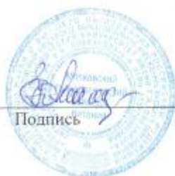
Е.Н. Махиненко Инициалы Фамилия

Составитель (автор): Охотина Е.Ф. преподаватель МТКП, РЭУ им. Г.В.Плеханова