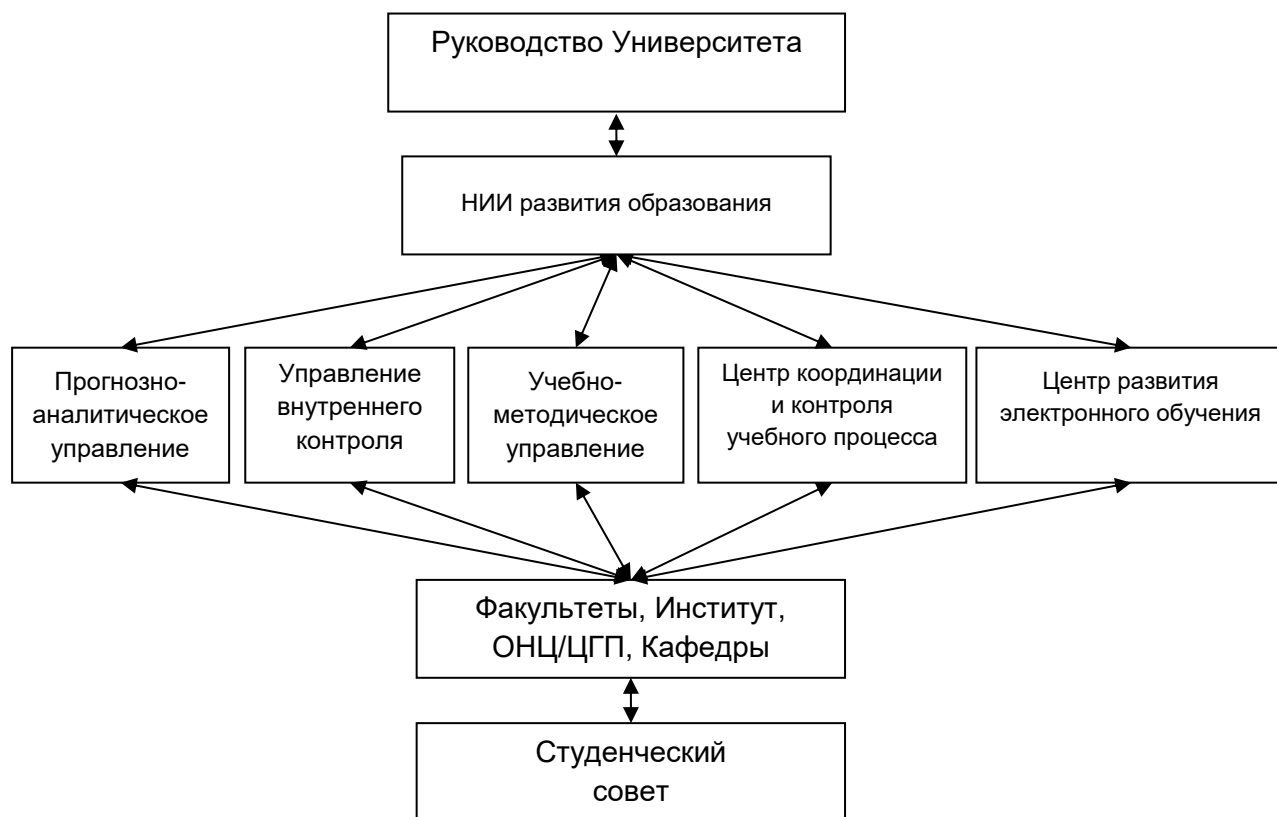
Рис.3. Организационная структура системы оценки качества образования в РЭУ им. Г.В. Плеханова

На рис. 3 представлена организационная структура внутривузовской системы оценки качества образования.